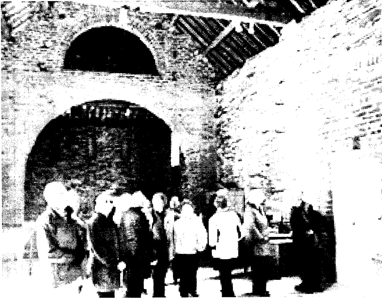
Lle roedd Cwmni Drama Garthewin wedi bod yn perfformio Dramau Saunders Lewis 40ml yn ol.