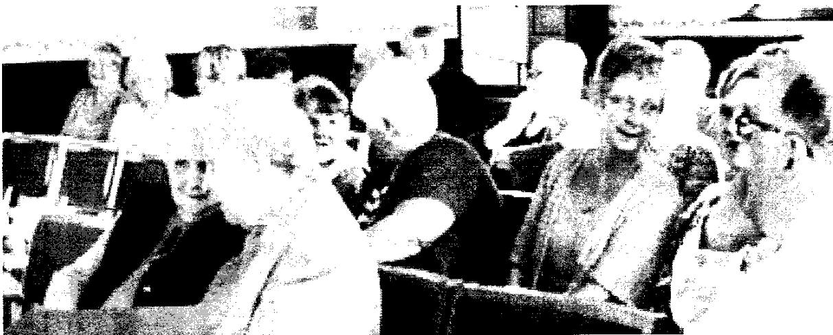
Merched y Fron yn mwynhau gweld Capel Nercwys ar ei newydd wedd.